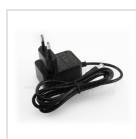
Alimentatore 5Vdc 1A