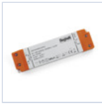
4714 DRIVER ISOLATO 24V IP20 200W