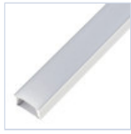
56694 PROFILO 2MT STRIP PLAFONE