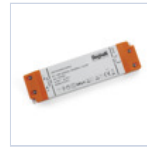
4713 DRIVER ISOLATO 24V IP20 150W