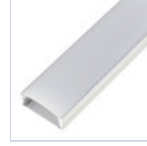
56690 PROFILO PLAFONE LARGO