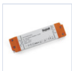
4710 DRIVER ISOLATO 24V IP20 60W