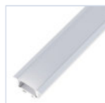
56695 PROFILO 2MT STRIP INCASSO