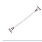
56622 CONN STRIP TO STRIP FILO 4 Pz