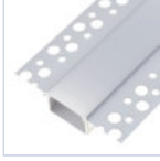
56693 PROFILO CARTONGES RASATO LARGO