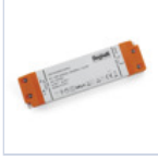
4709 DRIVER ISOLATO 24V IP20 30W