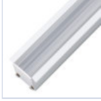
56629 PROFILO INC FONDO CARTONGESSO