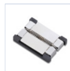
56620 CONNETTORE STRIP TO STRIP 10Pz