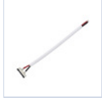
56621 CONNETTORE STRIP TO DRIVER 5Pz