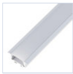
56695 PROFILO 2MT STRIP INCASSO