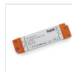
4712 DRIVER ISOLATO 24V IP20 100W