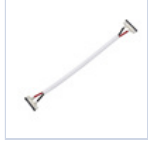
56622 CONN STRIP TO STRIP FILO 4 Pz