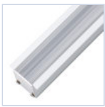
56629 PROFILO INC FONDO CARTONGESSO