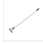
56621 CONNETTORE STRIP TO DRIVER 5Pz