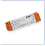
4714 DRIVER ISOLATO 24V IP20 200W