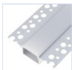
56693 PROFILO CARTONGES RASATO LARGO