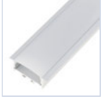
56691 PROFILO CARTONGESSO CON MOLLE