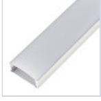
56690 PROFILO PLAFONE LARGO