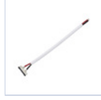
56621 CONNETTORE STRIP TO DRIVER 5Pz