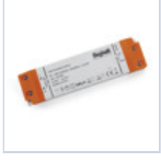
4709 DRIVER ISOLATO 24V IP20 30W