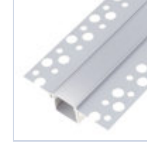
56692 PROFILO CARTONGESSO RASATURA