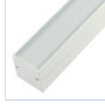
56628 PROFILO 2MT STRIP DISSIPATORE