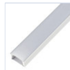
56694 PROFILO 2MT STRIP PLAFONE