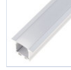
56696 PROFILO INC FONDO CARTONGESSO