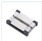
56620 CONNETTORE STRIP TO STRIP 10Pz