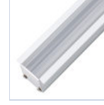
56629 PROFILO INC FONDO CARTONGESSO