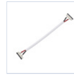
56622 CONN STRIP TO STRIP FILO 4 Pz