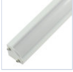
56627 PROFILO 2MT STRIP ANGOLARE