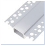
56693 PROFILO CARTONGES RASATO LARGO