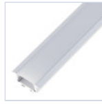
56695 PROFILO 2MT STRIP INCASSO