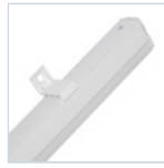
424020004 GR ACCESSORY RGL LEDECO