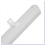
424020004 GR ACCESSORY RGL LEDECO