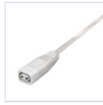
424020006 MAIN POWER L1500 REGLED ECO