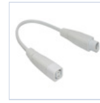
424020003 CONNECTION PLUG 150 RGL LEDECO