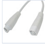
424020005 CONN PLUG 1.5MT RGL LEDECO