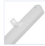
424020004 GR ACCESSORY RGL LEDECO