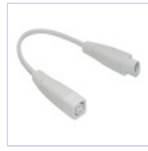
424020003 CONNECTION PLUG 150 RGL LEDECO