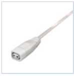
424020006 MAIN POWER L1500 REGLED ECO