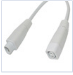
424020009 CONNECTION PLUG 2MT RGL LEDECO