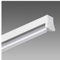
6402 Rapid system - monolampada LED