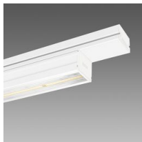
6604 Techno System - diffondente 60° - CRI 90