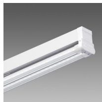
6502 Rapid system - bilampada LED