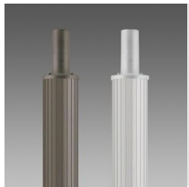
1508 Palo rigato ø 120 con base