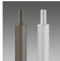
1509 Palo rigato ø120