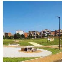
1493 Palo con base