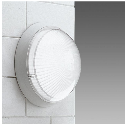
1544 Globo LED