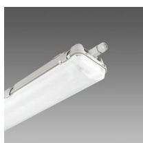
957 Echo - bilampada LED - High Performance