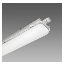
963 Hydro LED - High Performance