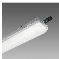
972 Hydro Style - alta resistenza agli agenti chimici