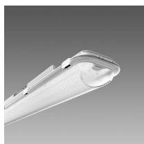
971 Ottima - High Performance