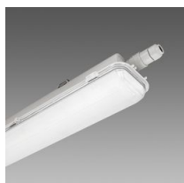
965 Hydro ICE-HT - high-low temperature