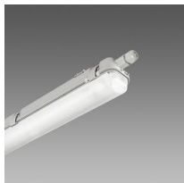
957 Echo - monolampada LED - High Performance