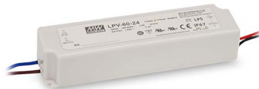
Fotografia indicativa del prodotto