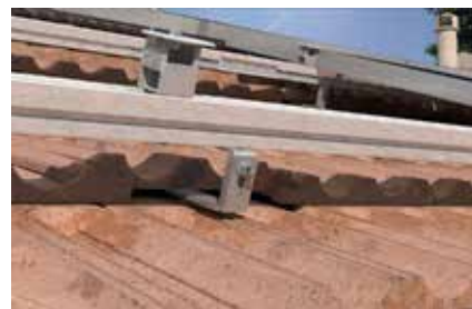
Dettaglio: Staffa GTPR