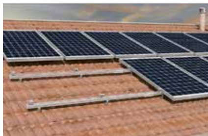
Tetto a falda con copertura in tegole