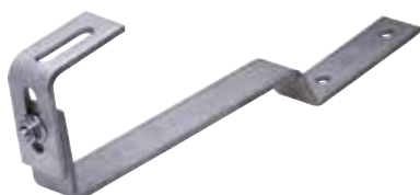
Gancio regolabile tegola piatta GTPR A2