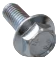
Vite testa esagonale flangiata SKS