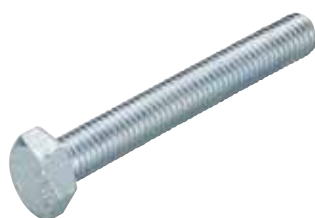
Vite testa esagonale SKS