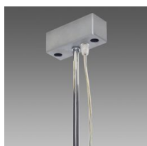
Sospensione elettrificata con tiges Q