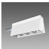
Sintesi Spot - UGR<22 - modulo luminoso