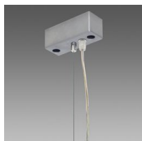
Sospensione elettrificata Q