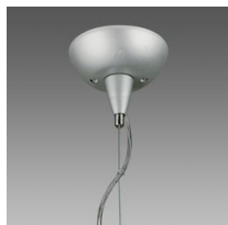
Sospensione elettrificata 3-5 poli