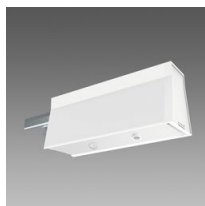
Sintesi Sensor - sensore di luminosità e/o presenza