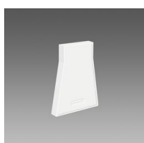
Testatina di chiusura 1 - Sintesi