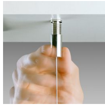
Sospensione semplice acciaio