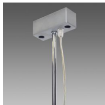
Sospensione elettrificata con tiges Q