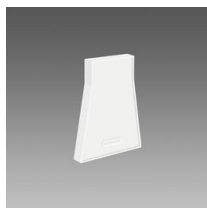
Testatina di chiusura 1 - Sintesi