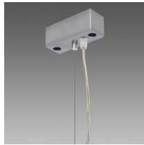
Sospensione elettrificata Q