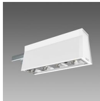
Sintesi Spot - UGR<22 - modulo luminoso