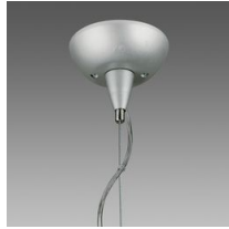
Sospensione elettrificata 3-5 poli