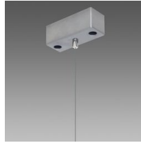
Sospensione semplice Q