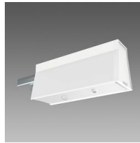
Sintesi Sensor - sensore di luminosità e/o presenza