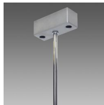
Sospensione semplice con tiges Q