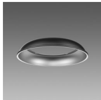
Riflettore Lucente 2.7 - UGR<25