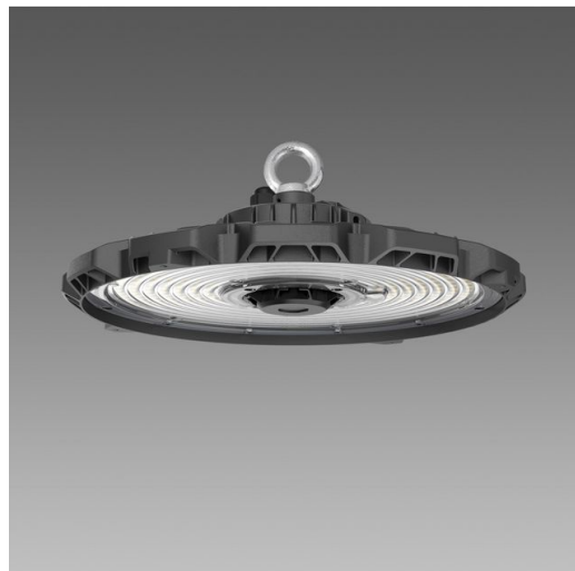
3700 Lucente 3.1