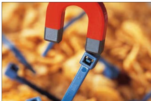
Le fascette rilevabili MCT(S) vengono utilizzate nell'industria alimentare e farmaceutica.

Può favorire la garanzia della qualità nei processi produttivi alimentari, per esempio HACCP.