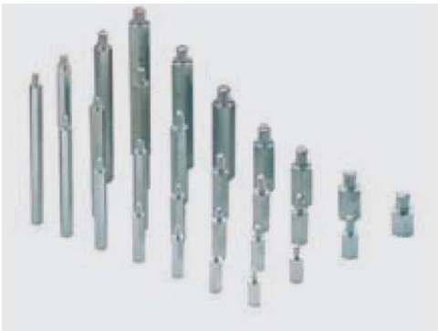
Foto del prodotto / Product image