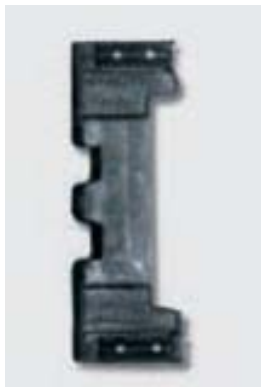
Foto dei prodotti / Products images