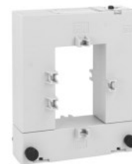
Trasformatori di corrente DM1TA0400