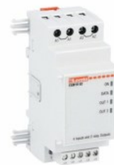
Moduli di espansione per prodotti modulari - ingressi / uscite EXM1002