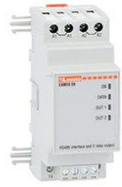
Moduli di espansione per prodotti modulari - Moduli di comunicazione EXM1020