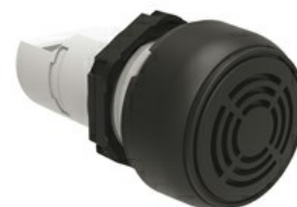
Ronzatore monoblocco - Suono continuo o intermittente LPCZS