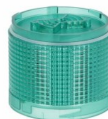
Colonne luminose Ø70 mm LTN70