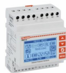
Sistema di protezione di interfaccia - Conforme norma CEI 0-21, bassa tensione (Italia) PMVF52