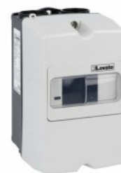
Contenitori da parete IP65 per SM1P... SM1Z Contenitori da parete IP65 per SM1P... SM1P...