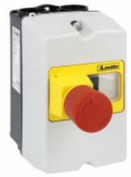
Contenitori da parete IP65 per SM1P... SM1Z Contenitori da parete IP65 per SM1P... SM1P...