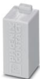
Modulo cieco HEAVYCON, per slot liberi nel telaio portamoduli

Si ricorda che i dati qui indicati sono estrapolati dal catalogo online. Per informazioni e dati dettagliati, consultare la documentazione per l'utente. Si intendono applicate le Condizioni di utilizzo generali per i download da Internet. ( http://phoenixcontact.it/download )