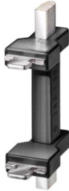
coltelli sezionatori NH gr. 00 attacchi liberi da tensione