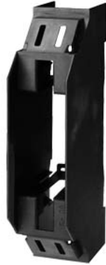
Copertura ISO IP2X grand. 00 per base portafusibili NH grand. 00