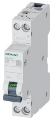
interruttore magnetotermico 230 V 6 kA, 1+N poli /1 UM C10