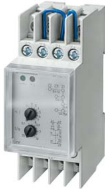
relè di minima corrente T5570 AC 230V 1/5/10/15A monofase con calotta trasparente