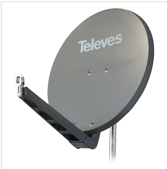
Televes si riserva il diritto di modificare il prodotto e/o specifiche tecniche indicate