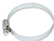
Anello in metallo