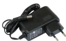
Adattatore 24 V 0,38 A