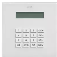
01705 - By-alarm tastiera con display