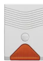
01715 - By-alarm sirena da esterno