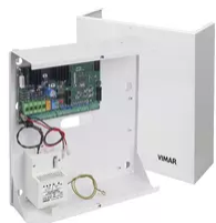
01700 - By-alarm centr. controllo 24 zone 230V~