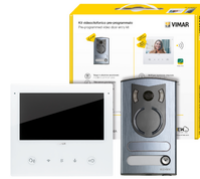
K40517.M - Kit video m/bif. Tab 7S Up Wi-Fi +13F2.1