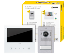
K40517G.01 - Kit video m/bif. Tab 7S Up Wi-Fi + 41005