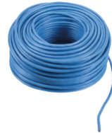
732H.E.100 - 2F+ cavo 2x1 posa interna PVC Eca 100m