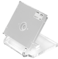
40596 - Base da tavolo Tab 7 UP