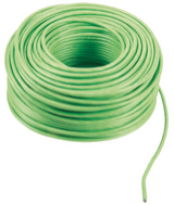
732I.E.100 - 2F+ cavo 2x1 posa esterna LSZH Eca 100m