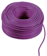
732I.C.100 - 2F+ cavo 2x1 LSZH Cca 100m viola