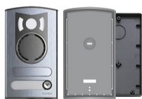
13K1 - Placca a/v 1 tasto alluminio