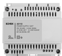
40110 - Alimentatore 2F+ 100-240V 1 OUT 1,6A