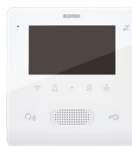
7558 - Videocitofono TabFree4,3 2F+vivav.bianco