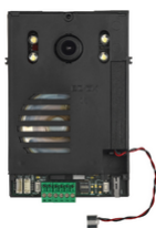
40135 - Unità 2F+ audio/video