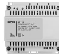
40110 - Alimentatore 2F+ 100-240V 1 OUT 1,6A