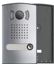
40151 - Placca audio/video monofamiliare