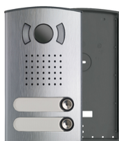
40152 - Placca audio/video bifamiliare