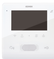
7558 - Videocitofono TabFree4,3 2F+vivav.bianco