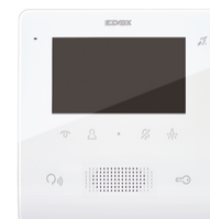
7559 - Videocitofono TabFree4,3 2F+vivav.bianco