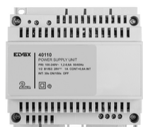
40110 - Alimentatore 2F+ 100-240V 1 OUT 1,6A