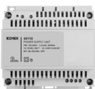
40110 - Alimentatore 2F+ 100-240V 1 OUT 1,6A