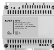
40110 - Alimentatore 2F+ 100-240V 1 OUT 1,6A