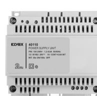
40110 - Alimentatore 2F+ 100-240V 1 OUT 1,6A