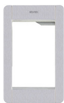
41131.01 - Supporto+cornice 1M Pixel grigio