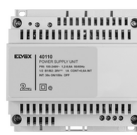
40110 - Alimentatore 2F+ 100-240V 1 OUT 1,6A