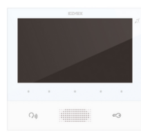
40505 - Videocitofono TAB 7 2F+ vivavoce bianco