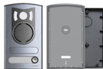
13K1 - Placca a/v 1 tasto alluminio