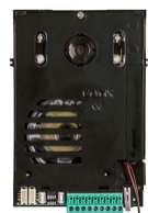
13F2.1 - Unità audio/video 2F+ per placca 13K1