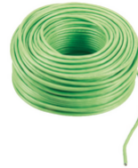
732I.E.100 - 2F+ cavo 2x1 posa esterna LSZH Eca 100m