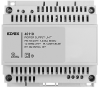
40110 - Alimentatore 2F+ 100-240V 1 OUT 1,6A