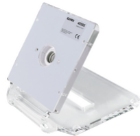
40595 - Base da tavolo Tab 5 UP