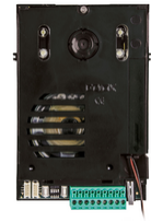
13F2.1 - Unità audio/video 2F+ per placca 13K1