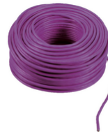
732I.C.100 - 2F+ cavo 2x1 LSZH Cca 100m viola