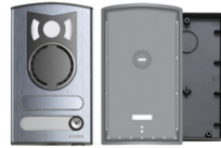
13K1 - Placca a/v 1 tasto alluminio