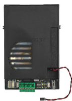
40131 - Unità audio 2F+ per placche 40141/40142