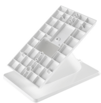
40598 - Base da tavolo Voxie bianco