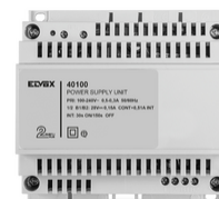
40100 - Aliment. Kit Cito m/b 2F+ 100-240V 0,6A