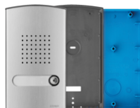
40141 - Placca audio monofamiliare